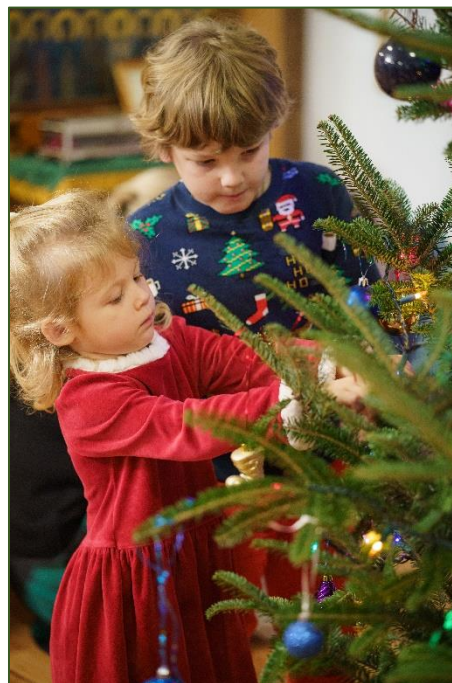
Новогодний молебен и украшение храмовой ёлки